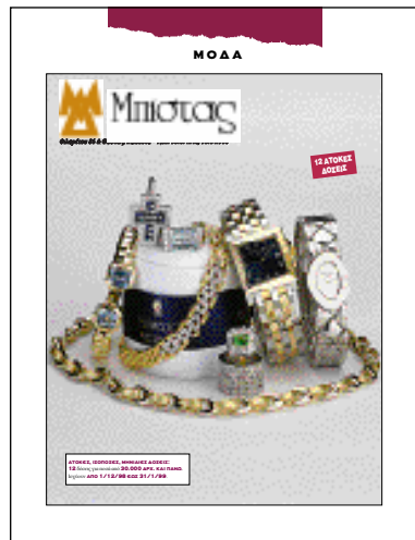
Πάντα πρωτοπόρο το DINERS CLUB δημιούργησε και εφάρμοσε πολλά χρόνια πριν το πρόγραμμα αγορών με άτοκες δόσεις.